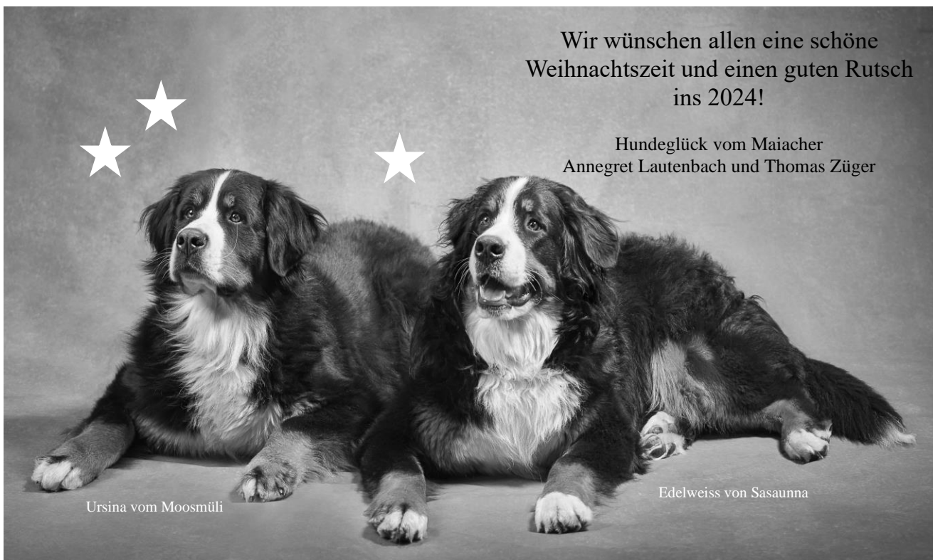
Ursina vom Moosmüli